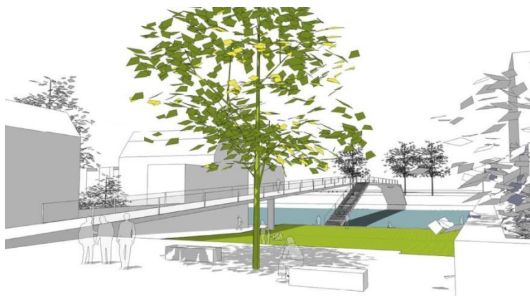
La création d'espaces publics en rive droite_2_ Copyright_Bureau Greish