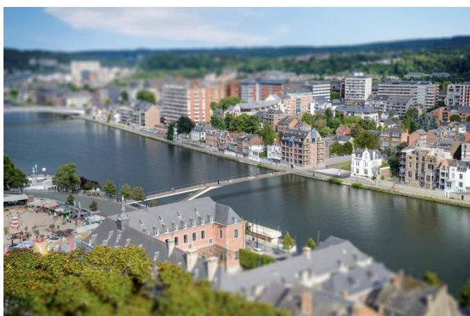
La Passerelle permet de nouveaux points de vue sur Namur et Jambes