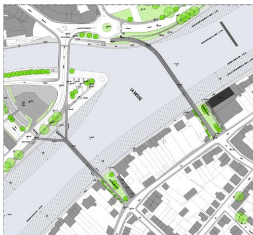
Les implantations développées