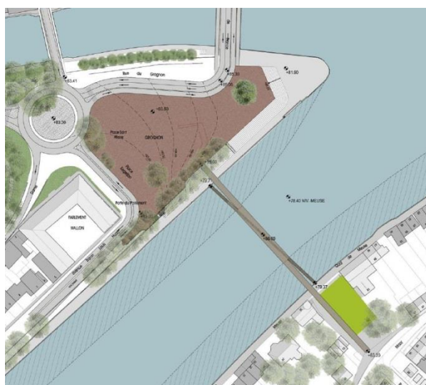
La passerelle passe de 3 à 2 branches