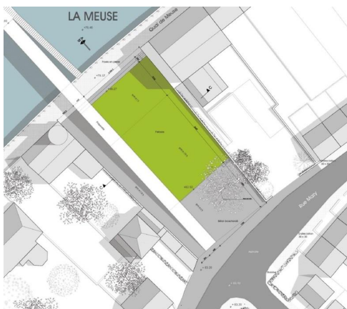
La création d'espaces publics en rive droite_1