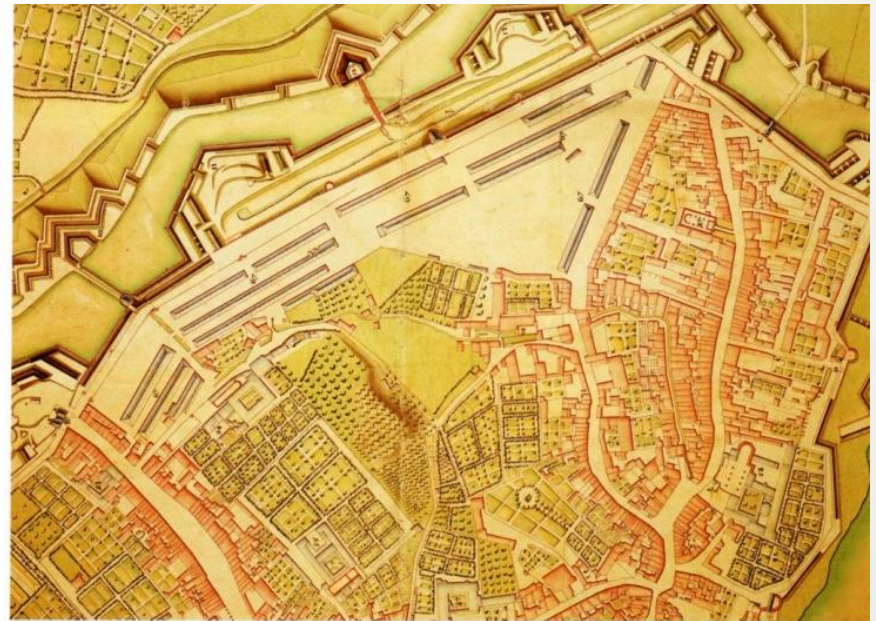
A l'est de la rue de Fer et jusqu'aux premiers ouvrages de la porte Saint-Nicolas, les casernes et divers bâtiments d'intendance. Le « triangle des Espagnols » respecté par les Français comme par les Hollandais est bien visible ici (plan G).

Toute la zone comprise intra-muros, entre la Quatrième Enceinte et le Houyoux (donc sur le site), dénommée « Herbatte », est restée longtemps vierge d'habitat et de constructions.