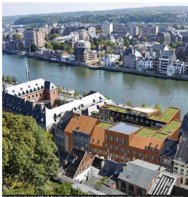
Le parlement est à l'étroit depuis plusieurs années. © Atelier de l'Arbre d'Or et Bureau d'Architecture Greisch

sens. Mais cette phase prévoit aussi de placer des garde-corps en verre blindé afin de protéger les occupants des lieux de toutes attaques extérieures. Ces travaux devraient être déjà réalisés cet été, durant les congrès parlementaires. Enfin, une partie du projet étonne : la construction d'un tunnel entre le parlement et le futur parking du Grognon dont on peut s'interroger sur son utilité (voir page 15). La totalité du projet a mûri pendant huit ans avec la Ville de