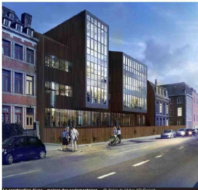
La construction d'une « maison des parlementaires ».